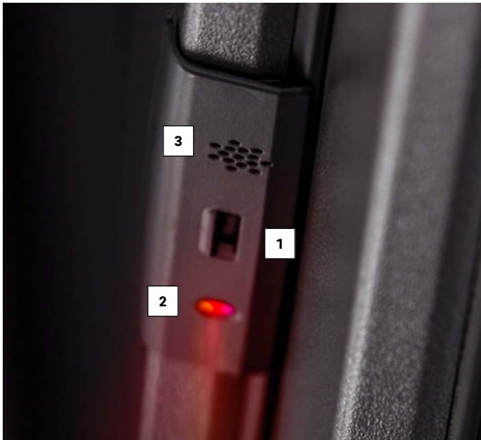
1 Senzorul de mișcare 2 LED 3 Emitătorul de semnale

Nu este nevoie de pereți înalți sau de sisteme de alarmă instalate în mod vizibil, pentru a vă simți în siguranță acasă. Smart Guard este încorporat în cadrul ferestrei și asigură în mod activ o siguranță preventivă. Senzorul inteligent de detectare înregistrează hoții și apoi declanșează în mod independent programul de protecție.