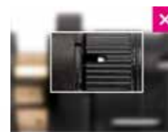
Sin inserción completa

El tubo debe estar en contacto con el collarín