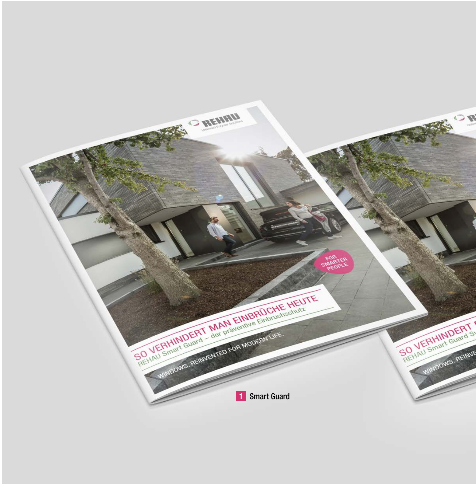
1 Smart Guard