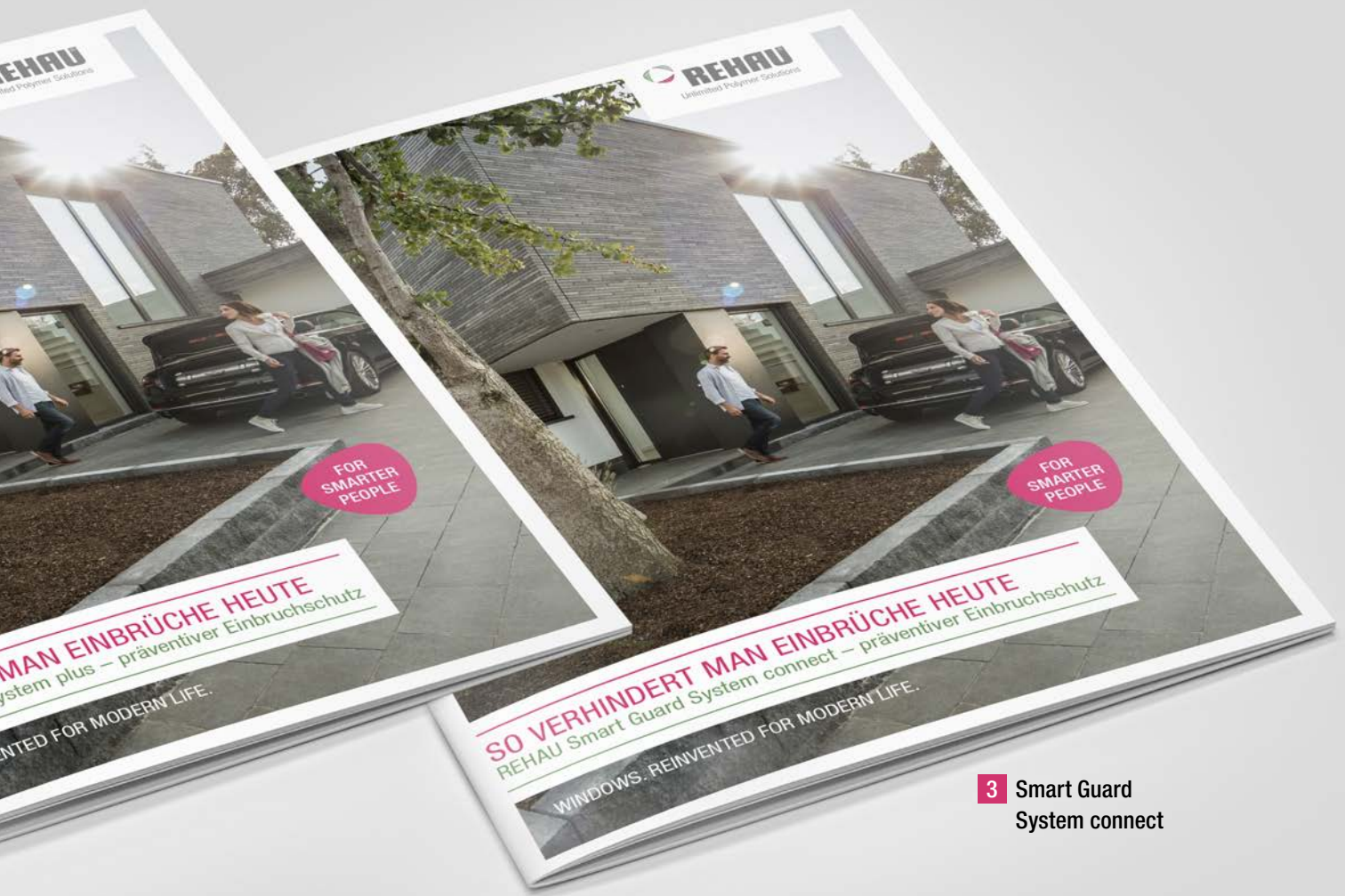
2 Smart Guard System plus