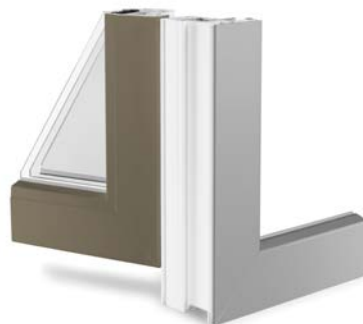
Skirtingos spalvos iš vidaus ir iš išorės