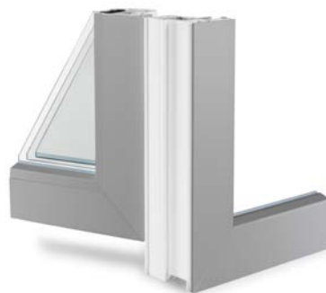
Ta pati spalva iš vidaus ir iš išorės