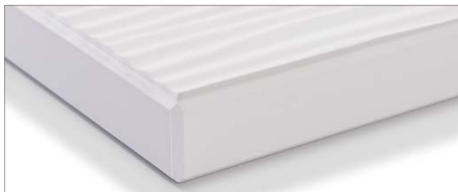
Laserbekantetes Bauteil (Individualmaße)

Alle Komponenten sind perfekt aufeinander abgestimmt und sorgen durch ihren symmetrischen Aufbau für eine hohe Stabilität.