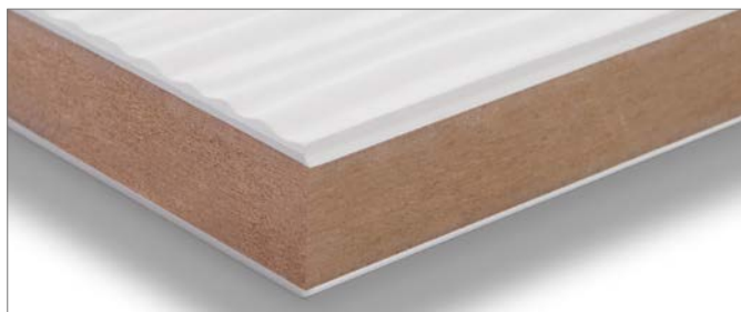
Mit MDF verpresste Platte (Großformat)