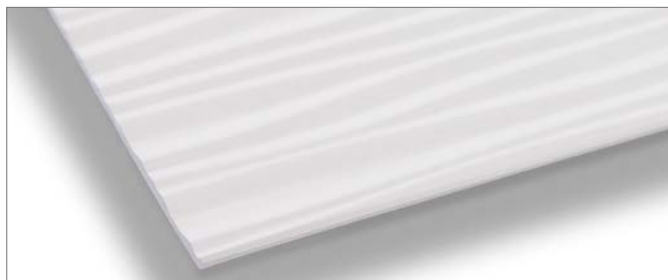
2,0 mm dünnes Laminat