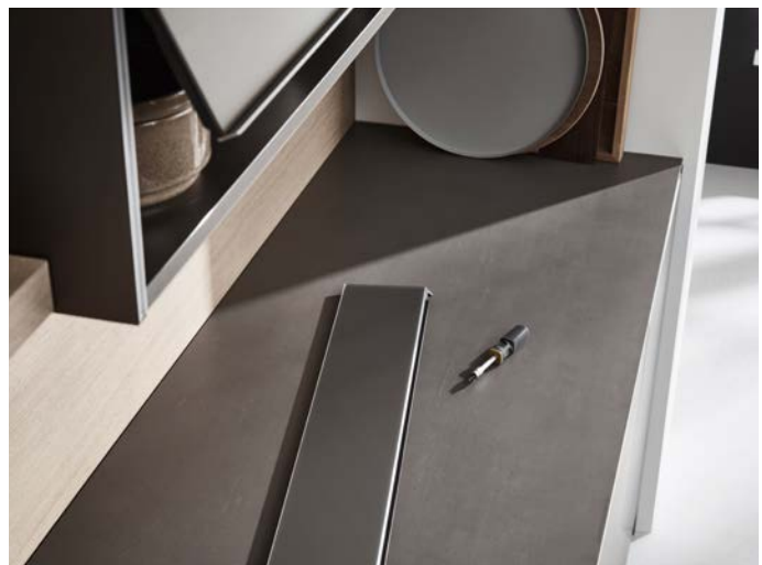
Lamellen können einzeln durch das Service-Team ersetzt werden.