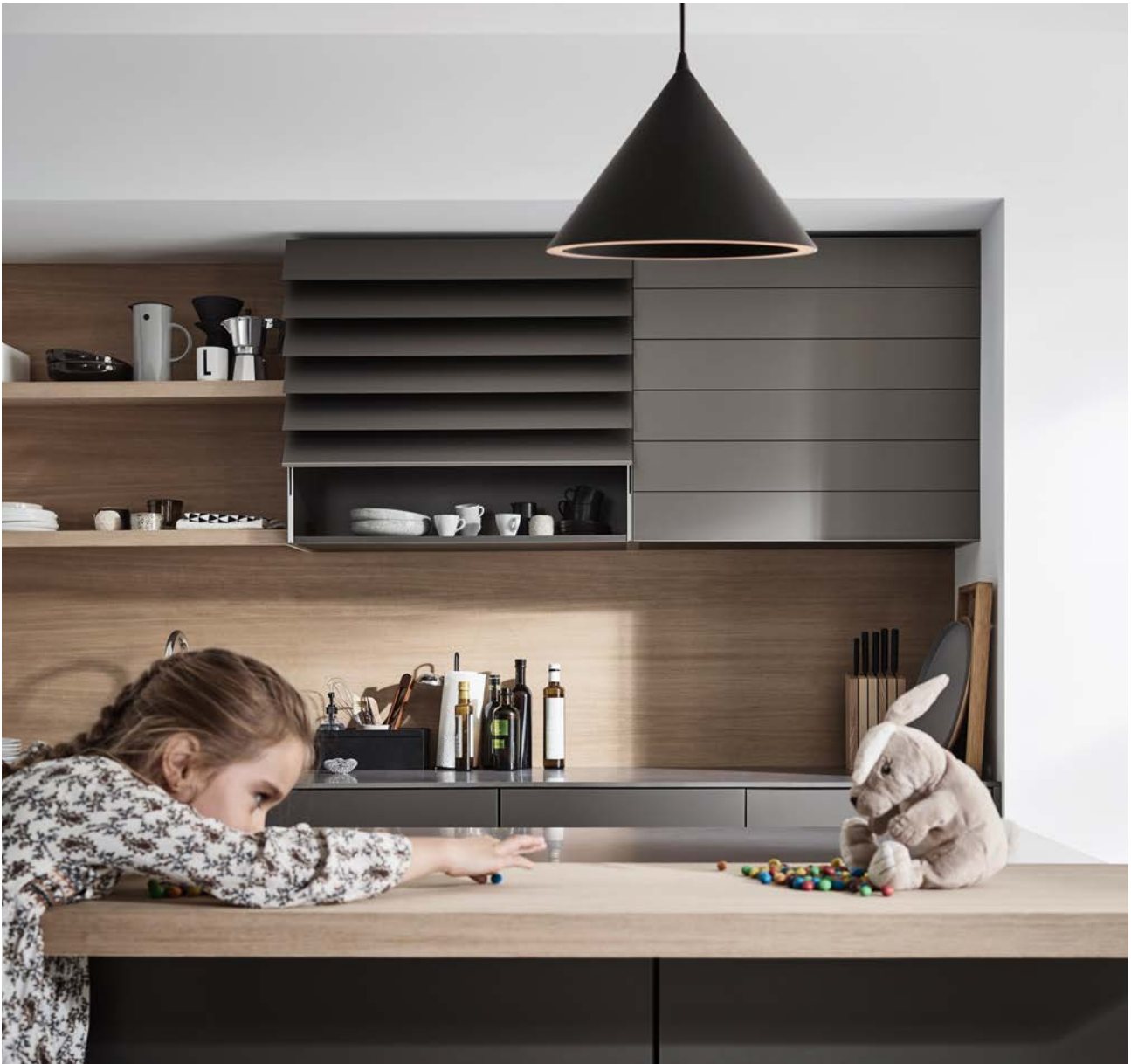
Der Facettenschliff der Lamellen sorgt für die einzigartige Optik.